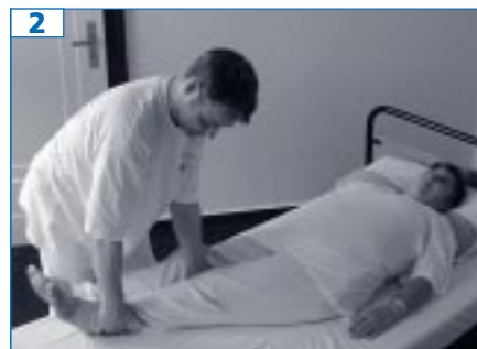
2 Das Bein wird möglichst immer von unten gegriffen und dann zum Rand der Matratze getragen. Greift man das Schienbein von oben, können dem Bed.* Schmerzen zugefügt werden.