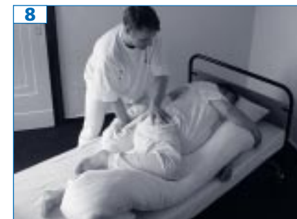
8 Während Sie nun den Pflegebedürftigen mit einer Hand am Becken (-kamm) festhalten (siehe Abbildung), pressen Sie Ihrem Angehörigen die Kissenrolle mit mittlerem Druck, über längs in den Rücken. Dabei reichen die Enden der Rolle ca. von den Schulterblättern bis zum Steißbein. Nun ist der Pflegebedürftige nach Rück(en)wärts abgesichert und kann nicht mehr zurückrollen.