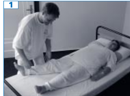
1 In den Abbildungen 1–5 sehen Sie die Pflegeperson (PP), wie sie den in der Mitte des Bettes liegenden Pflegebedürftigen (Bed.), von unten nach oben zum gewünschten Bettrand befördert.

Heute möchten wir Ihnen einen Pflegetipp vorstellen, der Ihnen die Lagerung einfacher machen und die Sturzgefahr für den Bedürftigen bannen soll. Voraussetzung für die Lagerung ist ein relativ hohes Bett (möglichst Pflegebett), ein zusätzliches (normal großes) Kopfkissen, welches wir Lagerungskissen nennen sowie eine Bettdecke, die zusammengerollt werden kann.